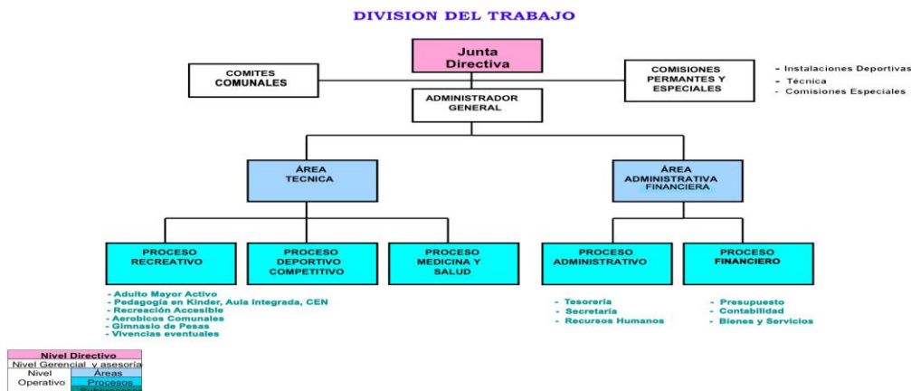
COMITÉ CANTONAL DE DEPORTES Y RECREACIÓN DE BELEN (CCDRB)

La Junta Directiva del CCDRB fue juramentada en el año 2014 por el Concejo Municipal y su Directorio está constituido (Ref.3808/2014) de la siguiente manera.